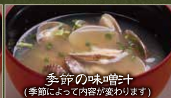
季節の味噌汁 (季節によって内容が変わります)